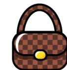
内側にICタグを装着